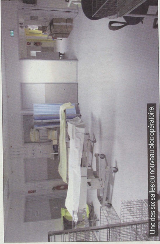
Une des six salles du nouveau bloc opératoire.