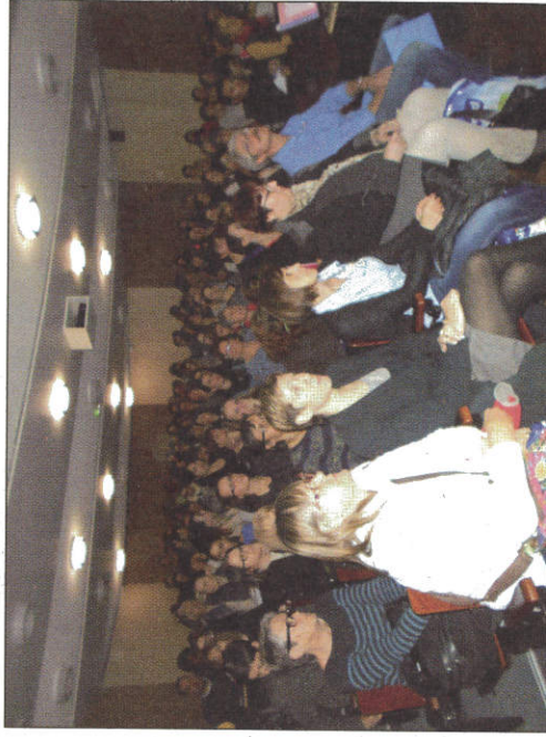
Beaucoup de monde lors des deux journées pour suivre les interventions des infirmières du CHU de Créteil.

L'escarre est une nécrose de la peau et parfois des tissus profonds. Elle apparaît aux endroits de pression quand une personne reste sans bouger dans son lit ou dans son fauteuil ou allité sur un plan trop dur. Toute personne allitée, quel que soit son état de santé peut développer des escarres, plus ou moins graves en fonction de différents facteurs. Ces plaies doivent être évitées à tout prix car elles sont douloureuses, longues à cicatriser et doivent être soignées par des traitements onéreux.